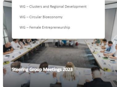
Steering Group Meetings 2023